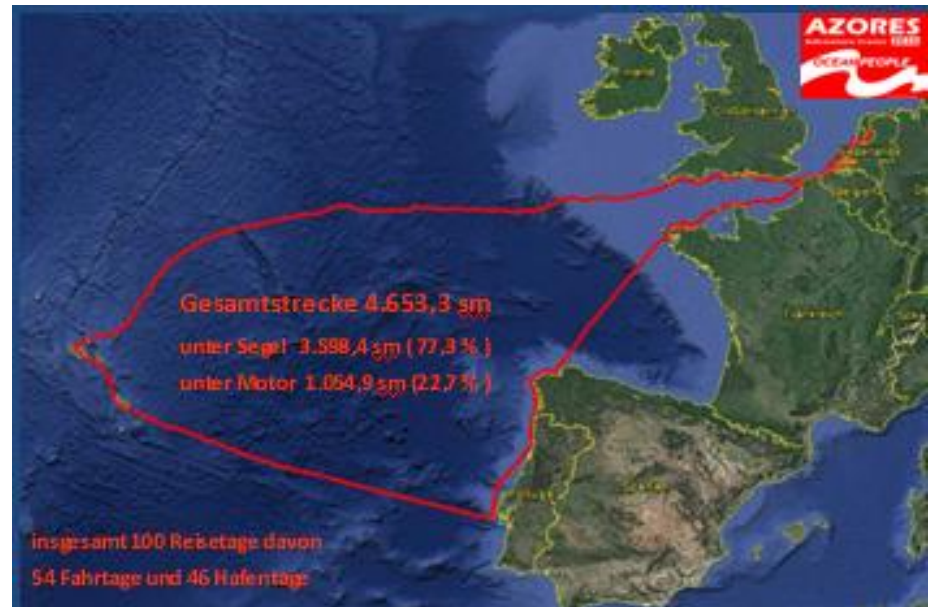
Illustration: Guido Marx

Eine Segelreise mit der playmobil, einer Breehorn 37, vom IJsselmeer quer über die Biskaya nach La Coruña und weiter entlang der portugiesischen Küste bis nach Lissabon, dann hinaus in den Atlantik zu den Inseln der Azoren und zurück entlang der südenglischen Küste zum Heimathafen Hindeloopen.