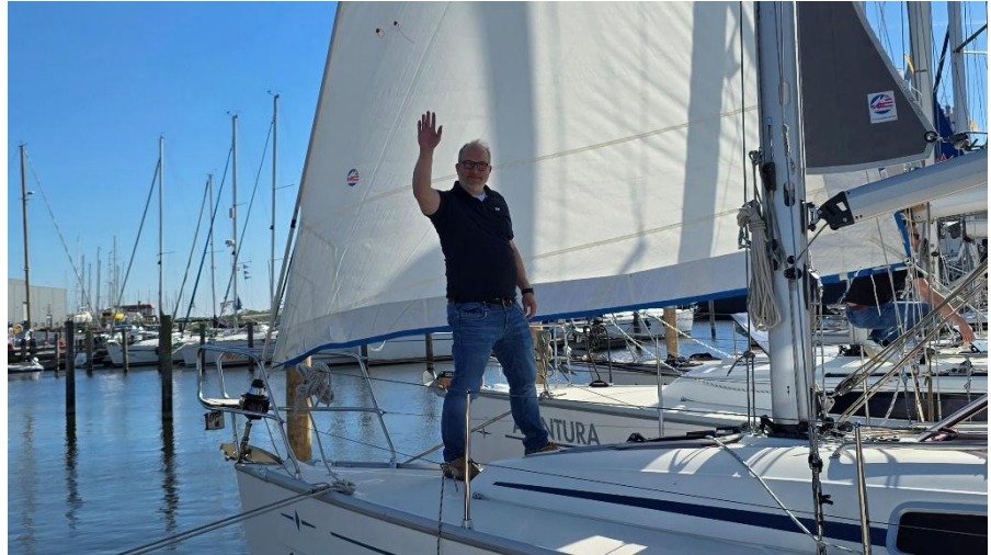
Segel testen am Donnerstagnachmittag. Sieht gut aus.

Ich durfte den ersten Anleger in Medemblik fahren. Und das gleich, um längsseits an unserem Flaggschiff anzulegen. So unter fachmännischer Beobachtung ist Anlegen doch gleich viel spannender als im Unterricht. Beim zweiten Versuch lief alles wie gewünscht. Zeit für das Anlegerbier.