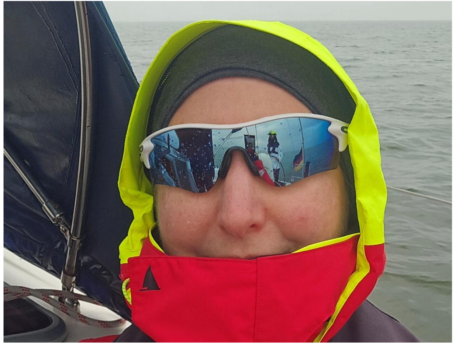
Es gibt kein falsches Wetter. Trocken und warm im Ölzeug.