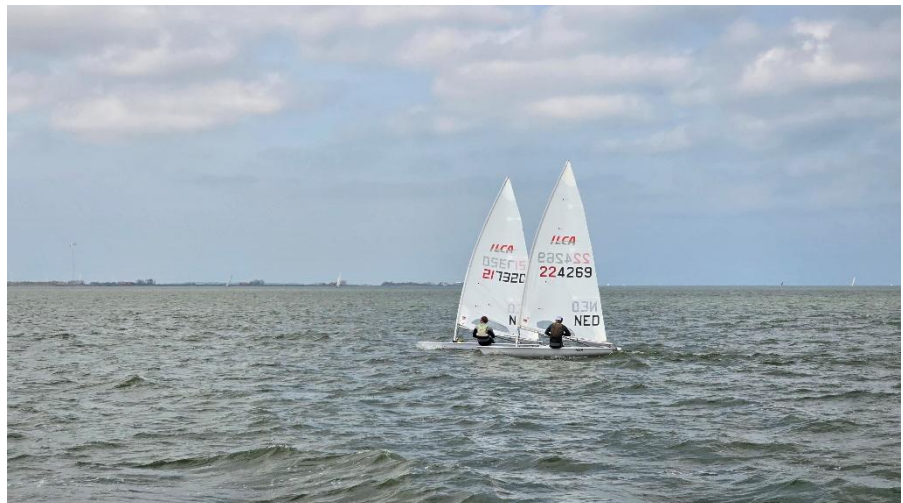
Ein feuchter Traum für Einhandsegler

Von der gemütlichen Position hinterm Steuer mit Kaffeeservice lässt sich gut wertschätzen, was für harte Arbeit Lasersegeln ist. Ich hätte nicht tauschen wollen in dem Moment. Der perfekte Segeltag endete in Hindeloopen, wieder längsseits an der Carpe. Hindeloopen hatte mehr zu bieten als nur gemütliche Kneipen und Restaurants: eine Fußballmannschaft feierte ihren Sieg, indem fast alle puddelrüh ins