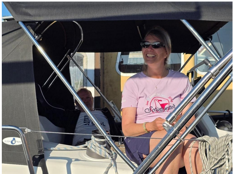
Längsseits an der Carpe

Morgens hieß es wieder früh ablegen, weil auf der Carpe ein akuter Fall von Heimweh ausgebrochen war. Also wieder eine gute Gelegenheit, Hafenmanöver zu machen. Unter Motor ging es dann zurück nach Lemmer.