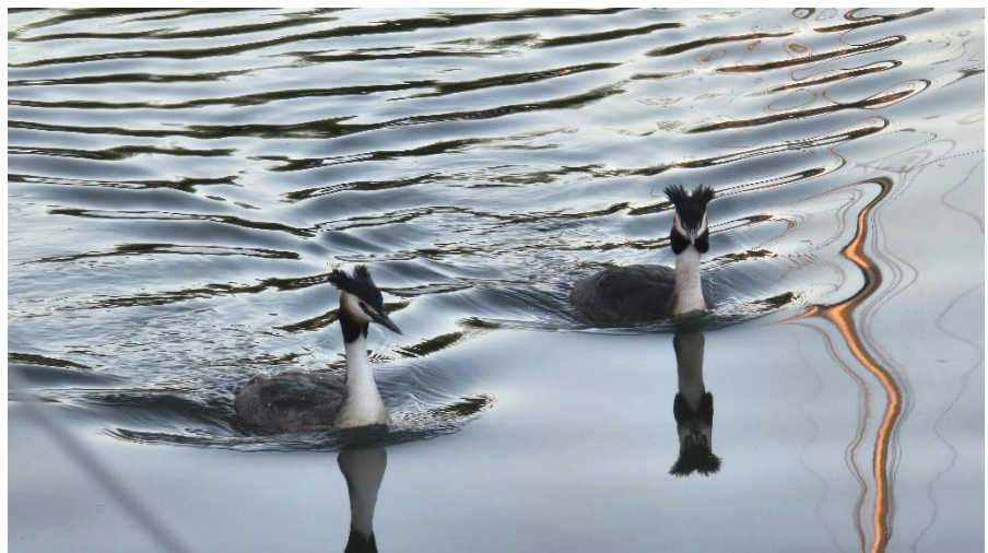
Tierisch gute Nachbarn