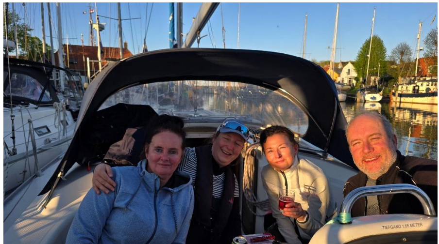
Das Lächeln noch strahlender als der Sonnenschein.

Ich durfte den ersten Anleger in Medemblik fahren. Und das gleich, um längsseits an unserem Flaggschiff anzulegen. So unter fachmännischer Beobachtung ist Anlegen doch gleich viel spannender als im Unterricht. Beim zweiten Versuch lief alles wie gewünscht. Zeit für das Anlegerbier.