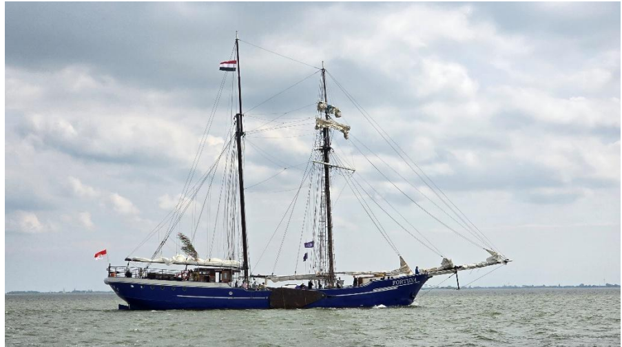
Kölsche Tön überall