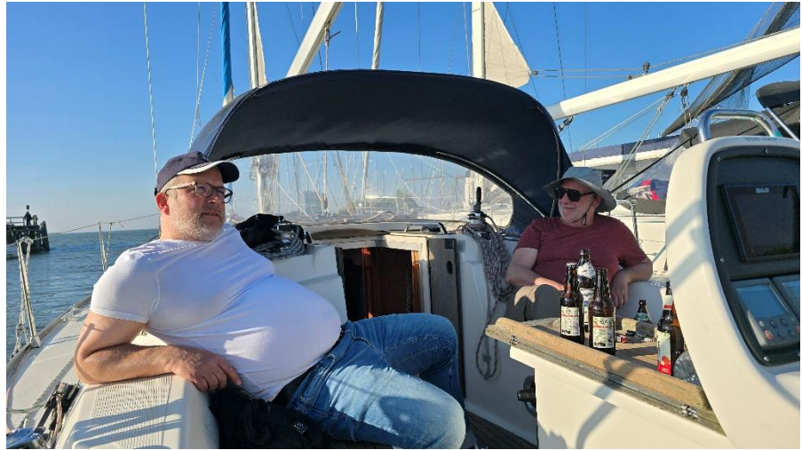
Sinnieren beim Anlegerbier

Wasser sprangen. Ein schöner Anblick, augenscheinlich war das Wasser leider sehr kalt. Die Jungs konnten es sicher als Eisbad verbuchen. Mit dem perfekten Sundowner und einem leckeren Abendessen endete der zweite Tag. Ich verdrängte die Tatsache, dass das Wochenende an nächsten Tag vorbei sein sollte.