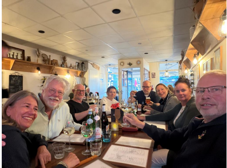
Start in der Pizzeria Delizia