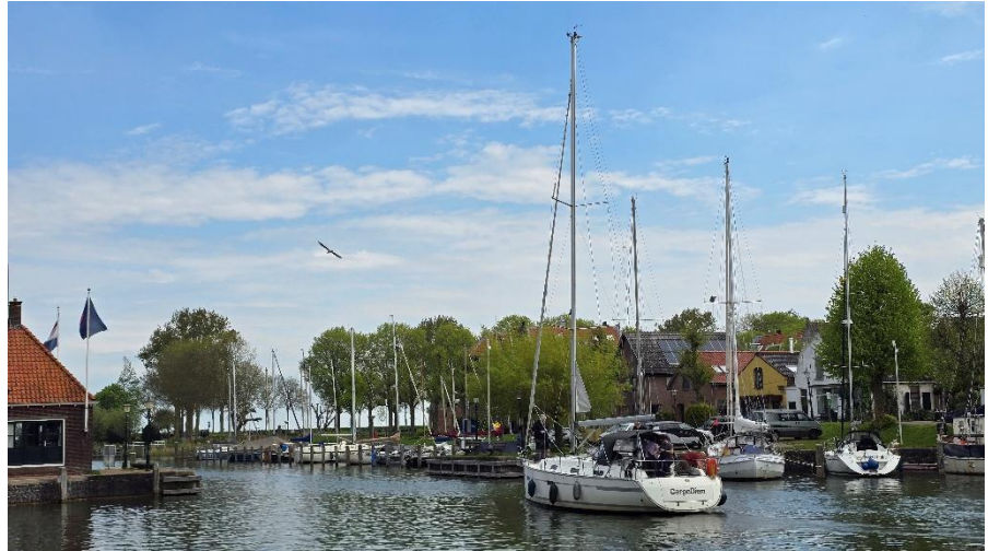
Wo die Carpe ist, ist vorne.

Am zweiten Morgen war frühes Ablegen angesagt, der innenliegende Nachbar wollte spätestens um 9.00 ablegen. Eine gute Gelegenheit für Balanceübungen und Hafenmanöver. Dann noch ein schönes Frühstück und weiter nach Hindeloopen. Schmetterlingssegeln bei Raumwind mit Wunschkonzert aus der Boombox. Uns begegneten wunderschöne Plattbodenschiffe und wir konnten Lasersegler bei einer Regatta beobachten.